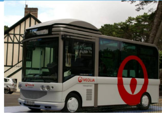
Veolia Transportin operoima täyssähkökubussi Gruau Ranskassa