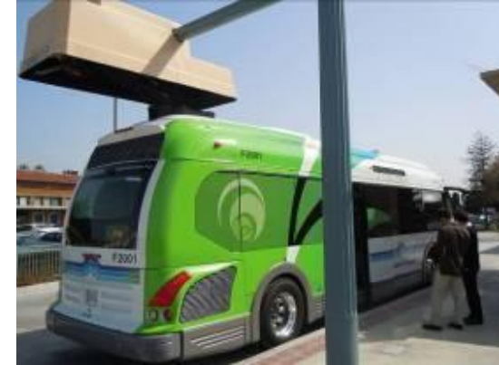
Veolia Transportin operoima täyssähköbussi pikalatausjärjestelmällä USA:ssa